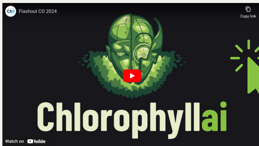
Flashout du CO

Pour vous inspirer, vous pouvez à la page d'introduction pour connaître le thème et visionner ceux des éditions précédentes